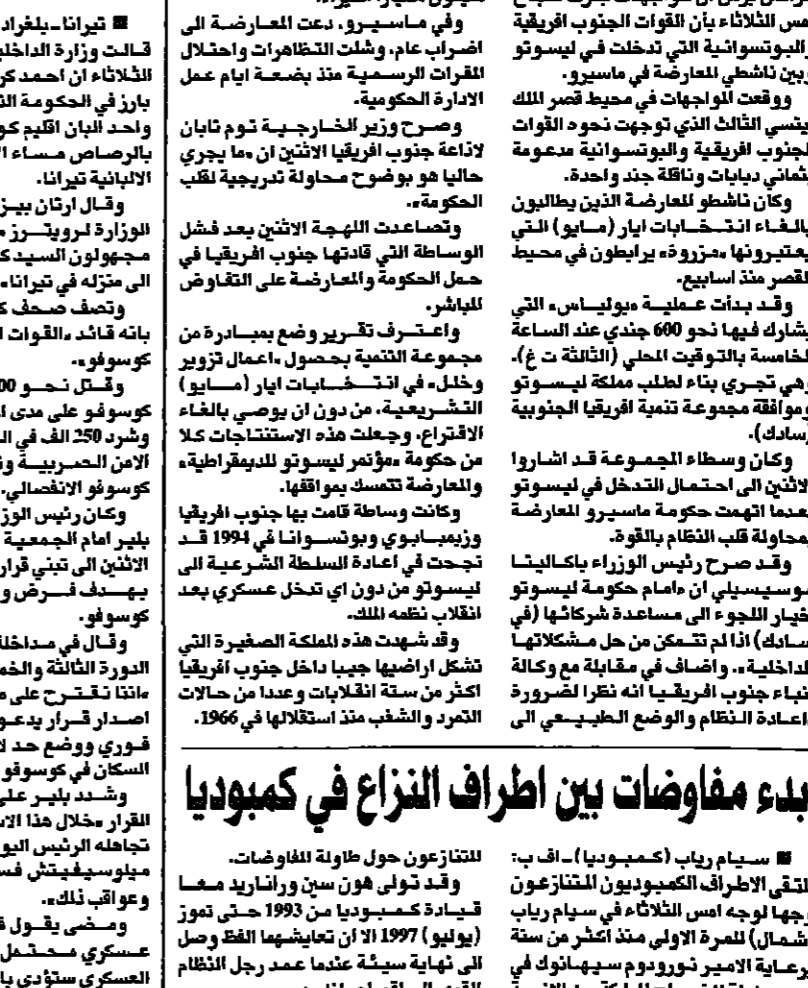
جثمان وزير دفاع كوسوفو، احمد كراستيفي سبجي في احد مستشفيات تيرانا عقب اغتياله (اس)